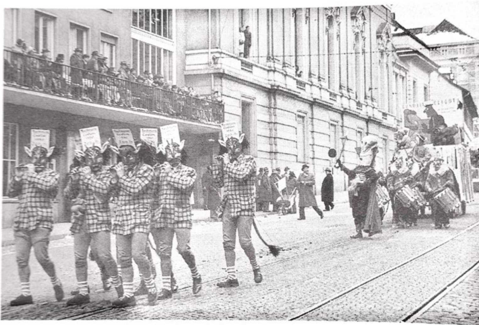
1. Fasnacht 1950, Sujet: Wo isch dr alti Fasnachtsgaischt?